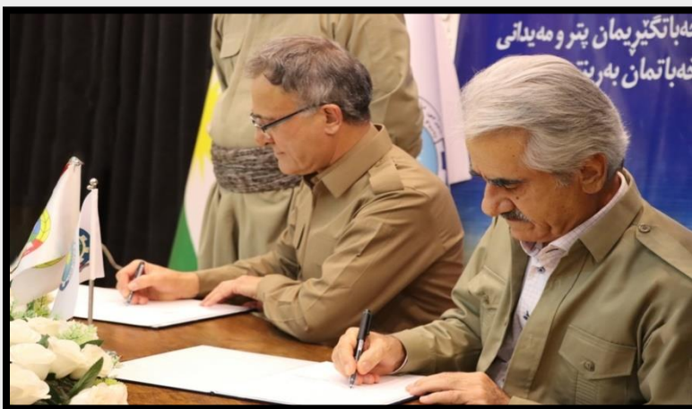
قادر وريا: پاراستى يەكگرتوۋىيى حىزب. دايكى ھەموو نەركەكانى دىكە يە

پرسىار ئەۋەيە: پىۋىستى يەكگرتنەۋەى حىزبى دىمۇكرات لە جىدا بوو، و ئەم يەكگرتنەۋەى چە دۇخىكى نوۋى دىكە بۇ حىزبى دىمۇكرات دەخولقىتى؟