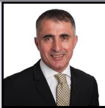
هه سه ن قاره مانى

رۆژی ٢٦ ی سه رماوهز بو کورد ته نیا رۆژیک نییه له رۆژمێردا؛ یاده وه ریبه کی ره گدا کوتاوی قوولته، هیماى بویری و پاراستنی ناسنامه و خه باتیکی بیوه ستانه بو نازادی. ئەم رۆژه نوینه رایه تیی وه رچه رخانیک ده کات له میژووی کوردستاندا، که خه ونی نه ته وه یه کی سه ربه خو ده ستی پیکرد. ئەم رۆژه ته نیا یادکردنه وه ی رووداویکی دیاریکراو نییه، به ئکوو گوزارشته له مانه وه ی گه ئی کورد و به رگریکردنیان له فهره نگ و ناسنامه و هه وئدانیان بو داها توویه کی نازاد و سه ربه خو. رۆژی