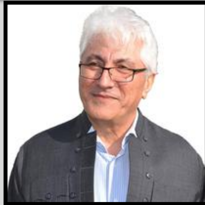
عهلی فه تھی

زۆریه ی گهلانی جیهان له سهردهمی خۆرژگارکردنیاندا خاوهن تایبه تهمه ندیبه کی میژوویی هاوشیوهن. نه گهر باسی نه و به شه وه لابنیین داخوا نه ده بیاتی بهرگری هاندەر بووه که خه لک به وشیاربیه وه به ره و بهر خۆدان ههنگاو بنیین، یا راپه رین و سه ره تان بوونه ته هۆی خۆتقانی نه ده بیاتی بهرگری، نه وه قه ناعه تیکی گشتی لای هه موومان دروست ده بی که پیمان