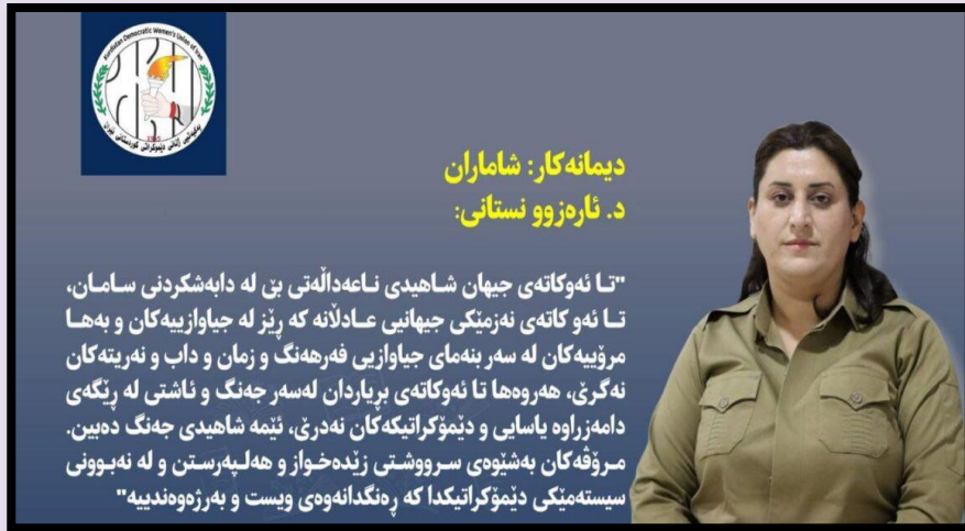
دىمانەكار: شاماران د. ئارەزوو نەستانى:

"تا ئەوكاتەى جىهان شاهىدى ناعەدالەتى بىن لە دابەشكردى سامان، تا ئەوكاتەى نەزمىكى جىهانى عادلانە كە پىز لە جىاوازىيەكان و بەها مرۆپىيەكان لە سەر بنەماى جىاوازيى فەرھەنگ و زمان و داب و نەرىتەكان نەگرى، ھەر وەھا تا ئەوكاتەى بىر ياردان لەسەر جەنگ و ناشتى لە رىنگەى دامەزراوە ياساى و دىمۆكراتىكەكان نەدرى، ئىمە شاهىدى جەنگ دەبىن. مرۆفەكان بەشۆھى سىرووشتى زىدەخواز و ھەلبەرىستن و لە نەبوونى سىستەمىكى دىمۆكراتىكدا كە رەنگدانەھى وىست و بەرزەھەندىيە"