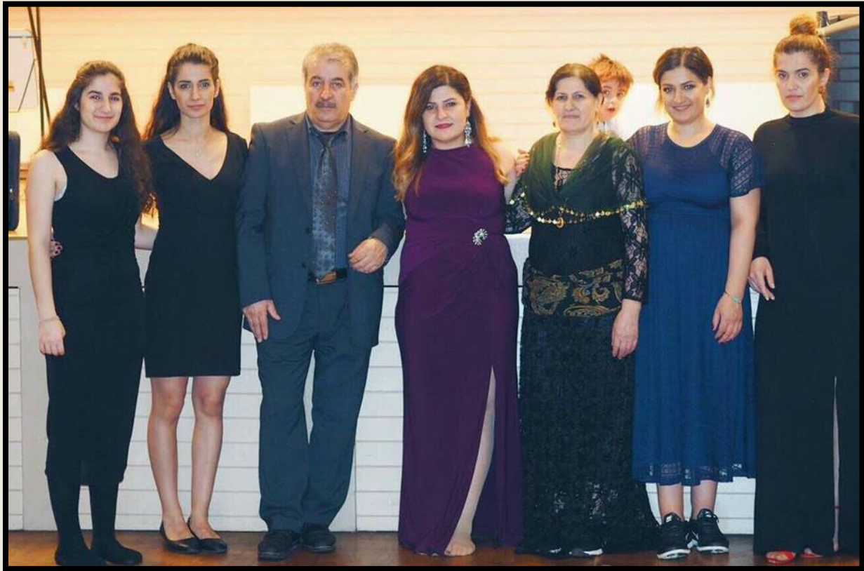
سلاو و ریز له بنه‌ماله‌ی تیکوښه‌رو خوښه‌ویستی؛ هاوړې هاشم روسته می