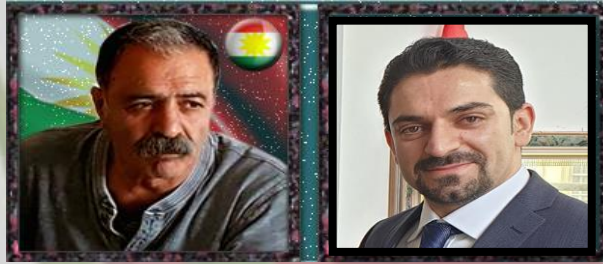
مادح نه حمەدی

پر به داخهوه، ته یفوور به تحایی، تیکۆشهرى دیرین و ناسراوی رۆژهه لاتی کوردستان بۆ هه میسه به جیهیشتین. کاک ته یفوور، که سایه تیه کی پر به رهه م و پیشهنگ بوو که شوینه واری به رهه مه کانی بۆ هه تاهه تاهیه له نه ده بیاتی بهرگری کورد دا ده مینیتته وه. به تحایی له قۆناغی دژواری خه باتدا له ریگای سینهما و فیلم و کامیراکه یه وه، به گژ داگیرکاری و سته مدا چوووه و داکۆکی له ماف رهواکانی نه ته وه که ی کرده وه.