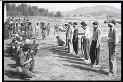
به‌شی پینجه‌م نووسینی: هۆمه‌ر