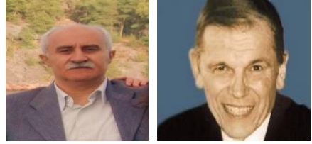
به شی دووهه م و کوژیایی

نوسه ر: لوونیس پ. پۆمه ن ، وه رگیر له سوئیدیپه وه: حامید مانیلی