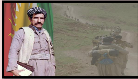
هاشم که ریمی

سائه کانی ۴۶ - ۴۷ ( ۶۷ - ۶۸ ی زاینی ) رژیمی هه مه ره زاشا تووشی نه خوشی خویه زل هیز زانین ببوو و به ته واوه تی خوی لی گورابوو. پارهی به لیشاوی نهوت به رادهیهک بوو که رژیم ئیدیعیای ده کرد دواي چهند سالی تر ده بیته هیزی پینجه می جیهان. هه موو حیزب و ریکخواه دیموکرات و پیشکه وتووخوازه کان سه رکوت کرابوون. به ناموژگاریی نه مریکا ریژیم ده ستیدابوو چاک کردنی زهوی و به شیک له جوتیارانی رازی کردبوو، تا رادهیهک خه یالی له شوړشیک جوتیاری ناسووده ببوو، هه رچهند به شیک له جوتیاران له بهر نه وهی بهر چاک سازی زهوی نه که وتبوون، روویان کردبووه شاره کان و تویشیک له بیکارانی ده وره بهری شاره گهورکانیان پیک هینابوو. نیمپریالیزمی نه مریکا به هه موو توانایه وه پشتیوانی لیده کرد و له بهرامبه ر پارهی زورو زه وهندی نهوت دا تازه ترین و به هیزترین چه کی پی ده فروشت. نه که ته نیا نه مریکا به لگوو هه موو ولاتانی سه رمایه داری پشتیوانی ریژیم بوون. ته نانهت نهو ولاتانهی به ناحق خویمان به ولاتی سوسیالیستی داده نا له بهرامبه ر هه مه رزا شادا ریایان ده کرد وبانگه یشتنیان ده کرد بو ولاتانی خویمان وزانکوکانیان دوکتورای ئیفتیخارییان به شا و شازن دها بو نه وهی سه ودا و مامه نه یان له گه ل بکا. نیران به نوینه رایه تی نه مریکا و بریتانیا ببوو ژاندارمی خه لیجی فارس و ته نانهت سوپای بو پشتیوانی له سوئانی عومان بو سه رکوتی شوړشگیرانی زوفار ره وانه کردبوو.