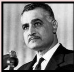
جه مال عه بدولناسر