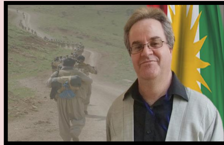
که مال هه سه ن پوور

فدیه سوفی سپانیایی جوړج سانتایانا وته یه کی به نرخ ی هه یه که ده لئ: نه وان ه ی دهرس له میژوو وه رناگرن مه حکوم به دوویات کردنه وه نی. جولانه وه ی ۴۶ - ۴۷ مومیک بوو له شه وزه نگی دیکتاتور یی شا دا که به شیک له باشت رین روله کانی که له که مان له روزه لاتی کوردستان گیانیان بو به خت کرد.