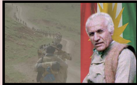
كه ريم حيسامى

سالى ۱۹۶۷ بو نهدامانى حيزبى ديموكراتى كوردستان كه له نيران راونرا بوون و په نايان بو كوردستانى عيراق و بو ناوچهى ژير دهسلاتى بزووتنه وى چه كدارى هينابوو، دهكرى به ساليكى رهش و شووم دا بنریت. به تاييبت بو نه و كه ساندى ناچنه ژير بارى ديكتاتورى و ملهورى نه حمهد توفيقه وه. كار به دهستانى بزووتنه وى كوردستانى عيراق دهست دهكهن به راوانان و گرتنى كورده نيرانيه كانى نه ندامى حيزبى ديموكرات و دهيانده نه وه به نيران.