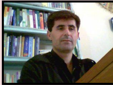
ناسر سألحی نەسل

لە کۆتاییەکانی دەیهی چلی هەتاویدا لە ناستی جیھانیدا، شەڕێکی سارد لە نیوان دوو جەمسەری رۆژئاوا و رۆژھەڵاتدا لە ئارا دابوو و هەركام لە جەمسەرەکانی ئامریکا و یەکیهتیی سۆقیهتی پیشوو بۆ پاراستنی بەرژەوهندی و پەرەپیدانی ناوچەیی ژێر دەسهلاتی خۆیان هەوڵیان دەدا. لە هەمان کاتدا لە بەشیک لە ولاتانی جیھاندا، بزووتنەوهیی رزگاریخواری گەلان، بە شیوهی خەباتی چەكدارانە بۆ دابین کردنی مافە سەرەکییەکانیان لە ئارا دابوو. لە قارەئاسیا شەری قەتنام و چەندین بزووتنەوهی رزگاریخواری گەلان بە شیوهی خەباتی چەكداریی لە ئارا دا بوو. نیوانی ولاتی چین بە ریبەیری مائۆ لە گەل ولاتی یەکیهتیی سۆقیهتی پیشوو زۆر ئاواز ببوو. لە ساڵی ۱۹۶۸ی زایینی لە ئوروپا، ئالیكساندر دوجچیک وەك سەرۆکی حیزبی كومونیستی چیكوسلۆفاکیا، بنچینەیی بەهاری پراگی دارپژریت و لە فەرانسە بزووتنەوهی خۆپنەكاریی لە ساڵی ۱۹۶۸ پاشەكشەیی بە دووگۆل سەرکۆماری ئەو کاتی ئەو ولاتی کرد. لە ئەمریکای لاتین جولانەوهیی رزگاریخواریی چەكداریی شكلیان گرتبوو. لە رۆژھەلاتی ئافیندا شەری ۶ رۆژە ئیسراییل و ولاتانی عەرەبی بە سەرکەوتنی ولاتی ئیسراییل کۆتایی پێهات. لە وەها بار و دۆخییدا رێژییمی حەمەرەزا شای پەهلەوی، بناغەیی دەسهلاتی رەشی دیکتاتوری خۆی قائمتر کردبوو. هەرودەها رێژییمی حەمە رەزاشا بە هۆی پۆلی زۆری فروشیی نەوت تووشی نەخوشیی خۆ بە زلزانین ببوو و بە تەواوتیی خۆی لیب گۆرابوو. بە هۆی پۆلی زۆر و زەوهندی نەوت، شا توانی تازەترین و باشتەیین چەك و چۆل بکریت و ئەرتەشیکیی بەهیزی دامەزراند. هەر بۆیە رێژییمی حەمە رەزا شا ببوو