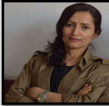
دیمانە لەگەڵ شایر مەحمودی

شایر مەحمودی: پێشەنگایەتی ژنان لە نارهزایەتیەکانی ئەم دوایاندا پرستیژ و ئیعتباری زیاتری بە بزوتنەوهی ژنان بەخشیوه ھەتا دێ ژنی کورد لە ڕەوتی بزوتنەوه کۆمەڵایەتی و مەدەنییەکانی کۆمەڵگەدا پتر دیار و شۆتندەر دەبن. ژنانی کورد بە پیناسەییەکی نوێ لە بوونگەرای خۆیان لە کایە سیاسی و کۆمەڵایەتیەکاندا بەشدارن و سەرەرای ھێزەندی کۆمەڵگەیی پیاوسالاری کوردستان و تێپەرێنەکردنی قوناعی ڕزگاری نەتەوویی، بەلام توانیویانە شۆت پەنجە بە سەر زۆر لە گۆرانکاریەکانەوه دیار بێ. "کوردستان" لە بارودۆخی ئیستای ئێران و تەقینەوهی نارهزایەتیە گشتییەکان بە ڕووی کۆماری ئیسلامیدا، بۆ زیاتر باسکردن لەسەر ڕۆل و پێگەیی ژنان و چەندی و چۆنی بەشدارییان لەو بزوتنەوانەدا وتووێژی لەگەڵ خاتوو شایر مەحمودی، ئەندامی ڕێبەری حیزبی دیموکرات و سکرتیری یەکیەتی ژنانی دیموکراتی کوردستان بیک ھیناوه.