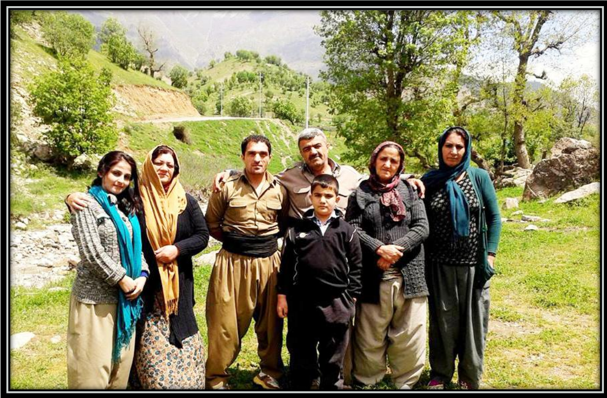
سلاو و ریز له بنه ماله‌ی پیشمه‌رگه و تیکۆشه‌ری خاتوو شه‌ونه‌م هه‌مه‌زه‌بی